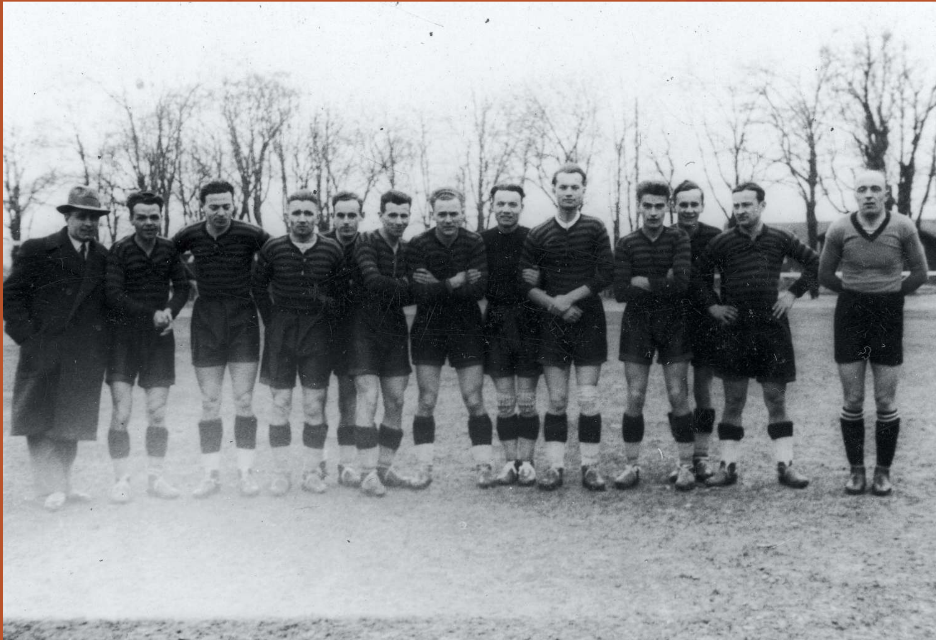
Zdjęcie: Drużyna piłkarska klubu sportowego Ukraina Lwów w 1934 r.