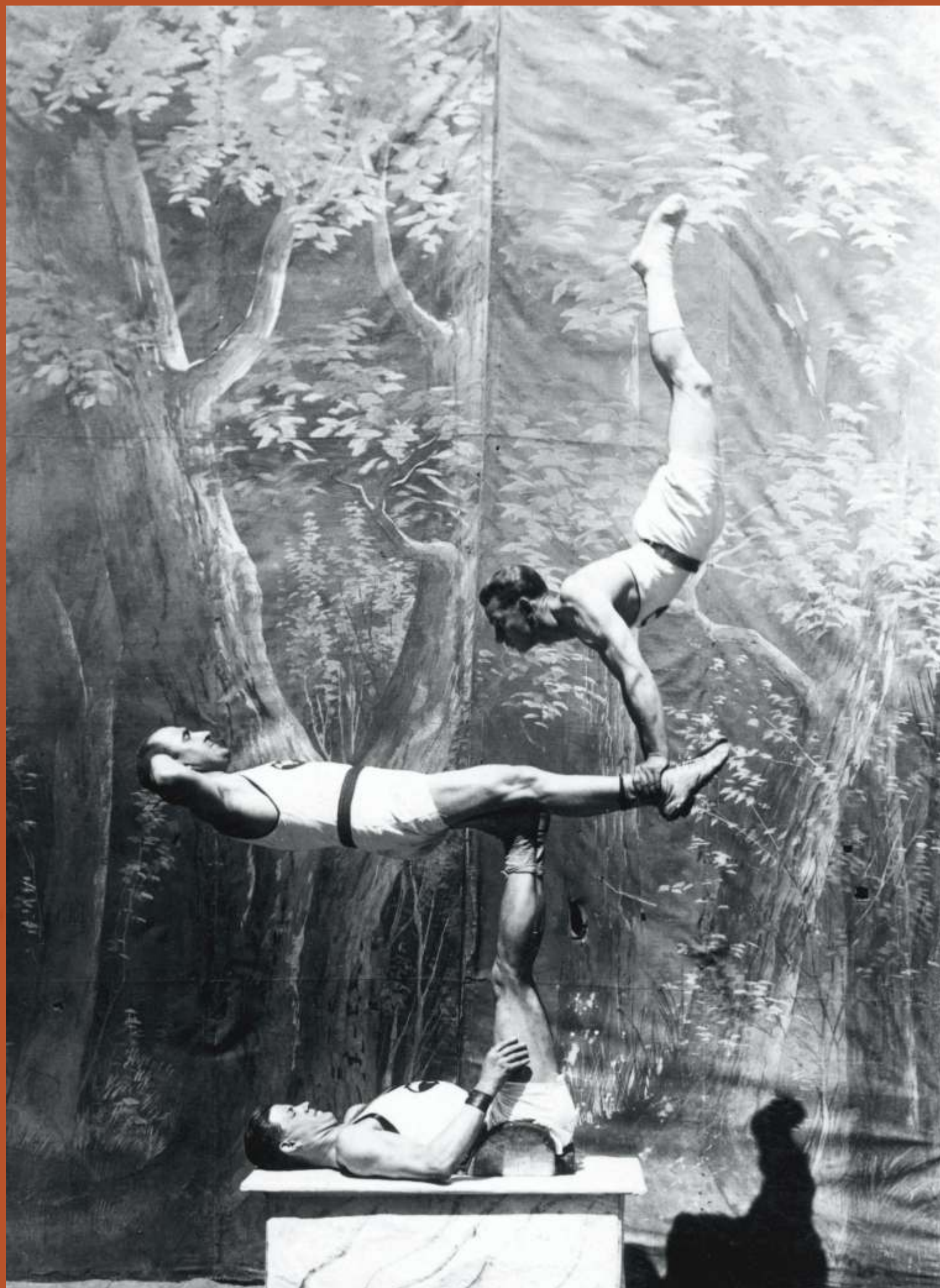
Zdjęcie: Pokaz gimnastyczny Towarzystwa Gimnastycznego „Sokół”.