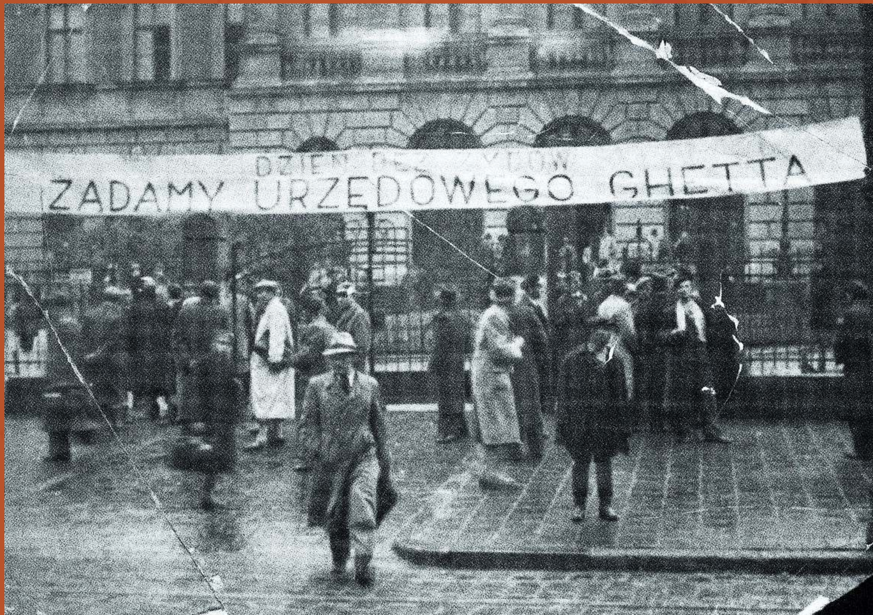
Zdjęcie: „Dzień bez Żydów” pikietą Obozu Narodowo-Radykalnego przed gmachem Politechniki Lwowskiej we Lwowie w latach 30. XX w.