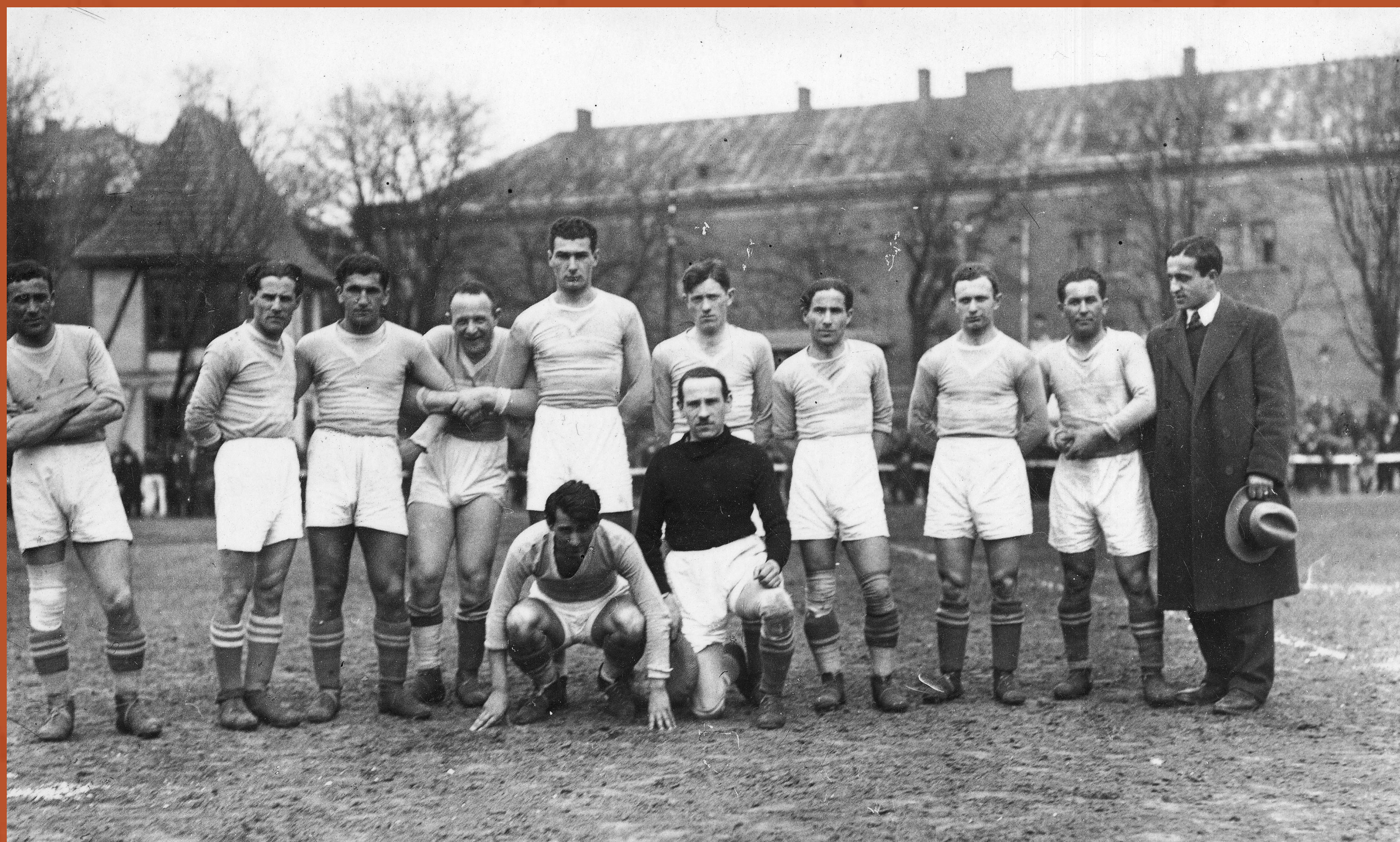
Zdjęcie: Drużyna piłkarska Żydowskiego Klubu Sportowego Hasmonea Lwów, 1933 r.