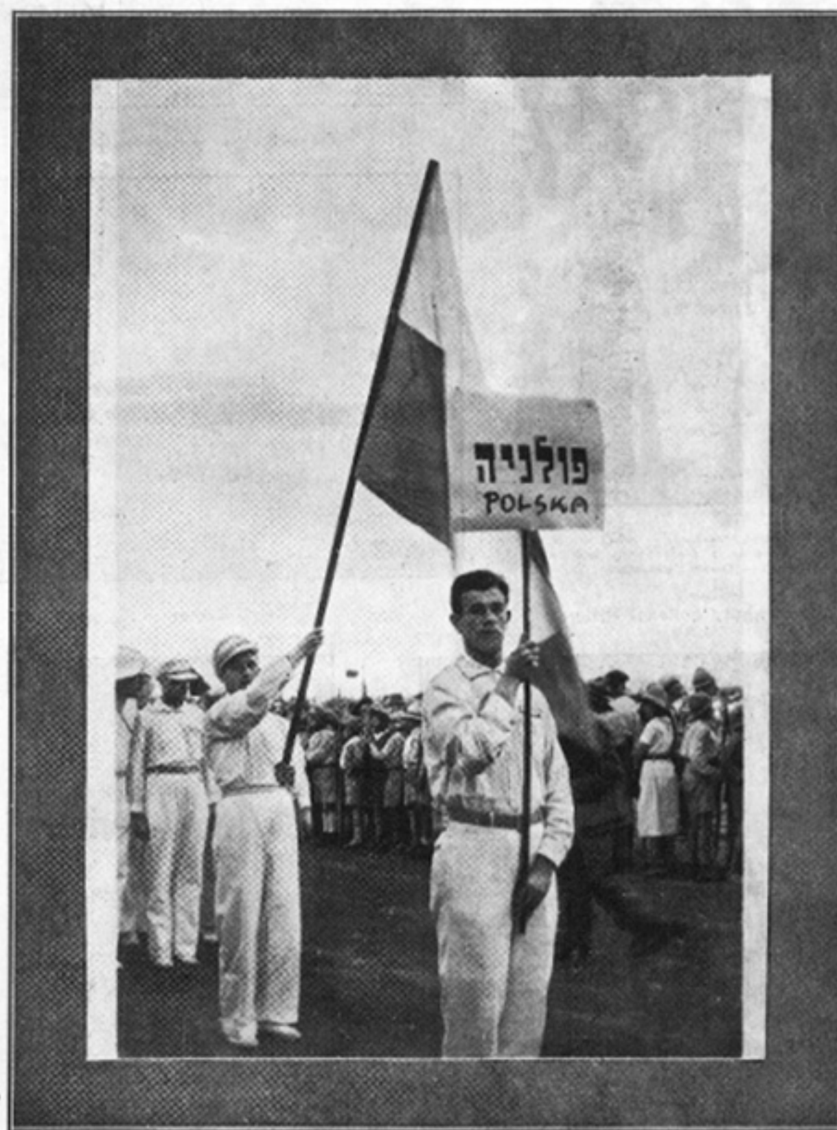
Zwycięska drużyna podczas defilady na „Makabiadzie”.