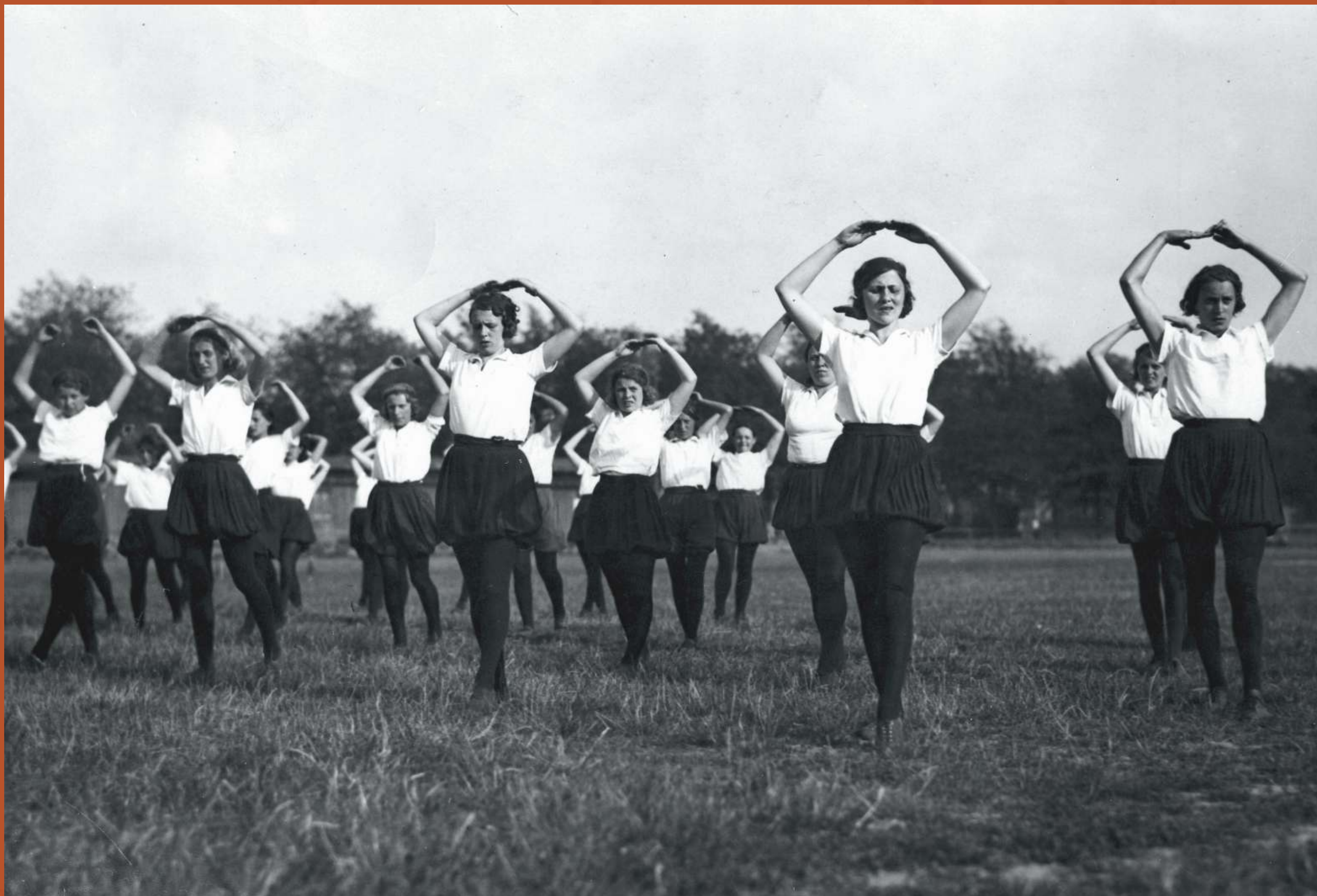
Zdjęcie: Pokaz gimnastyki wykonany przez drużynę żeńską Towarzystwa Gimnastycznego „Sokół” na stadionie w Poznaniu w 1936 r.