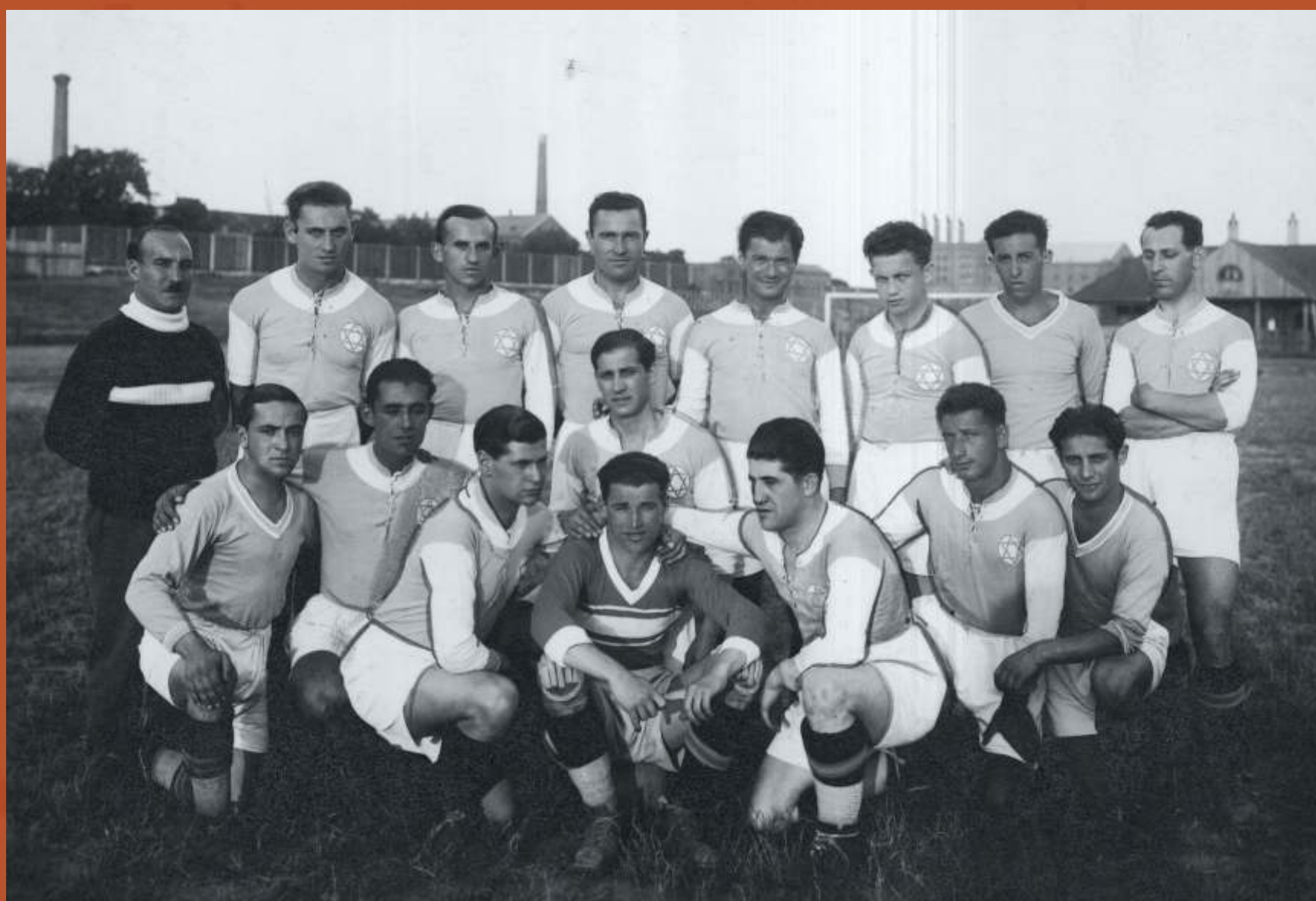
Zdjęcie: Członkowie sekcji piłkarskiej klubu sportowego Hakoah Wiedeń, 1933 r.

W 1924 r. zorganizowano mecz między najlepszą żydowską drużyną Hakoah Wiedeń, a Polonią Warszawa. Prasa reklamowała to jako sensacyjne spotkanie dwóch narodowości: polskiej i żydowskiej. Rywalizacja między narodowościami i wzajemne niechęci zostały przeniesione na boisko. Na niewielki stadion Agrykoli (kilka tysięcy widzów) przybyło 40 tysięcy widzów. Doszło do bijatyki, którą na szczęście przerwała ulewa. Więcej nie reklamowano tak wydarzeń.