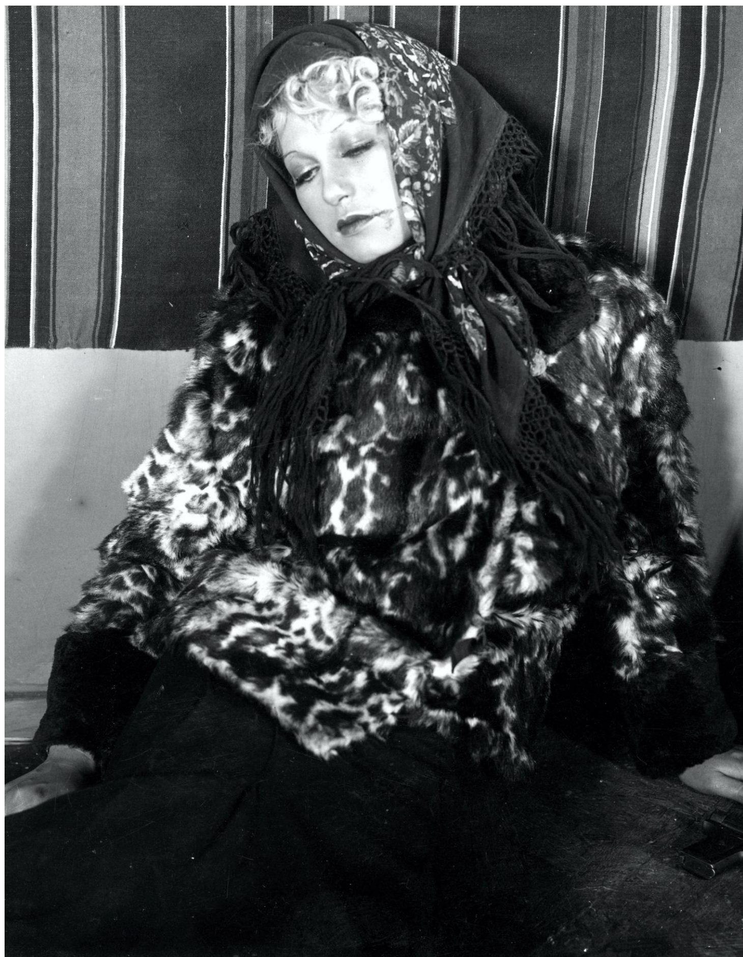
Ina Benita w jednej z ról, lata 30. XX w.

Przez wiele lat dalsze losy Benity nie były znane. Najczęściej przyjmowano, że zginęła razem z synem w kanałach lub doszła nimi do Śródmieścia i tam, we wrześniu, straciła życie podczas bombardowania. Informacje o jej śmierci były kwestionowane przez środowiska aktorskie, które zakładały, że uciekła z kraju – nie były jednak w stanie tego udowodnić.