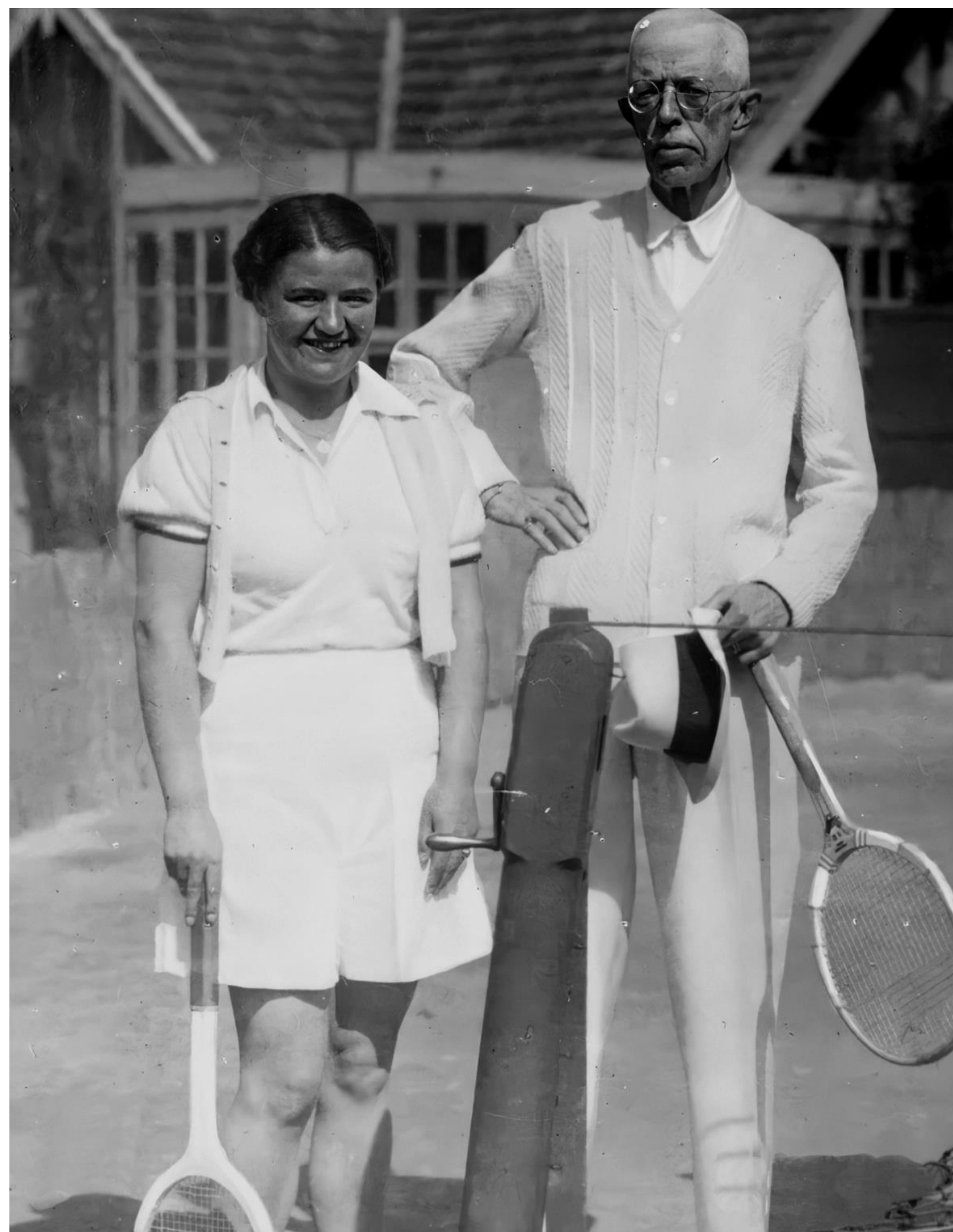
Jadwiga Jędrzejowska i król Szwecji Gustav V, 1936 r.

Kilka razy proponowano jej wyjazd z kraju: ambasada amerykańska, król szwedzki Gustaw V (na zdjęciu Jędrzejowska na korcie z królem Gustawem V, z którym grywała przed wojną na Riwierze Francuskiej), wreszcie Niemcy.