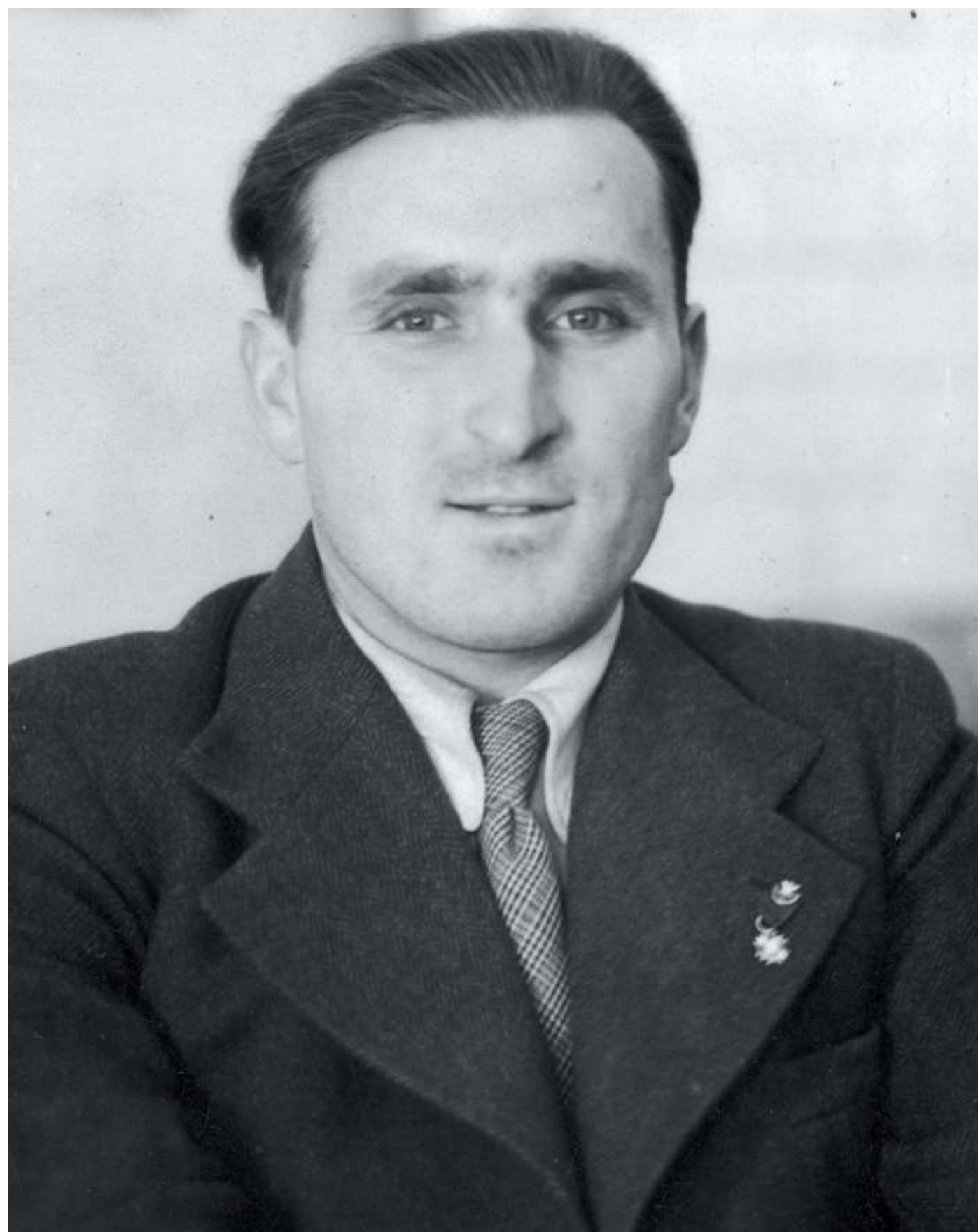
Janusz Kusociński, fotografia portretowa, 1935 r.

W czasie okupacji pracował jako kelner w barze „Pod kogutem”, gdzie prowadził działalność konspiracyjną. Był członkiem podziemnej Organizacji Wojskowej „Wilki” (działał pod pseudonimem „Prawdzic”). Zbierał informacje od gestapowców, m.in. o Polakach ze świata kultury, nauki i sztuki przeznaczonych do eksterminacji. Przewoził amunicję, rozwoził ulotki. W marcu 1940 r. został aresztowany przez Gestapo. Uwięziony, początkowo w więzieniu mokotowskim, następnie w siedzibie Gestapo przy al. Szucha. W czasie przesłuchań był torturowany. Nikogo nie wydał. Został rozstrzelany przez Niemców w pobliżu Palmir na obrzeżach Puszczy Kampinowskiej.