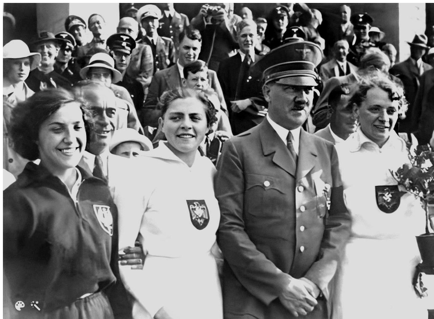
Maria Kwaśniewska na Letnich Igrzyskach Olimpijskich w Berlinie, sierpień 1936 r.