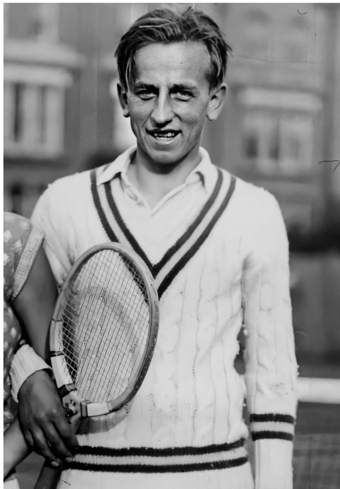
Ignacy Tłoczyński na Międzynarodowym Turnieju Tenisa Ziemnego w Queen`s Club w Londynie, czerwiec 1931 r.