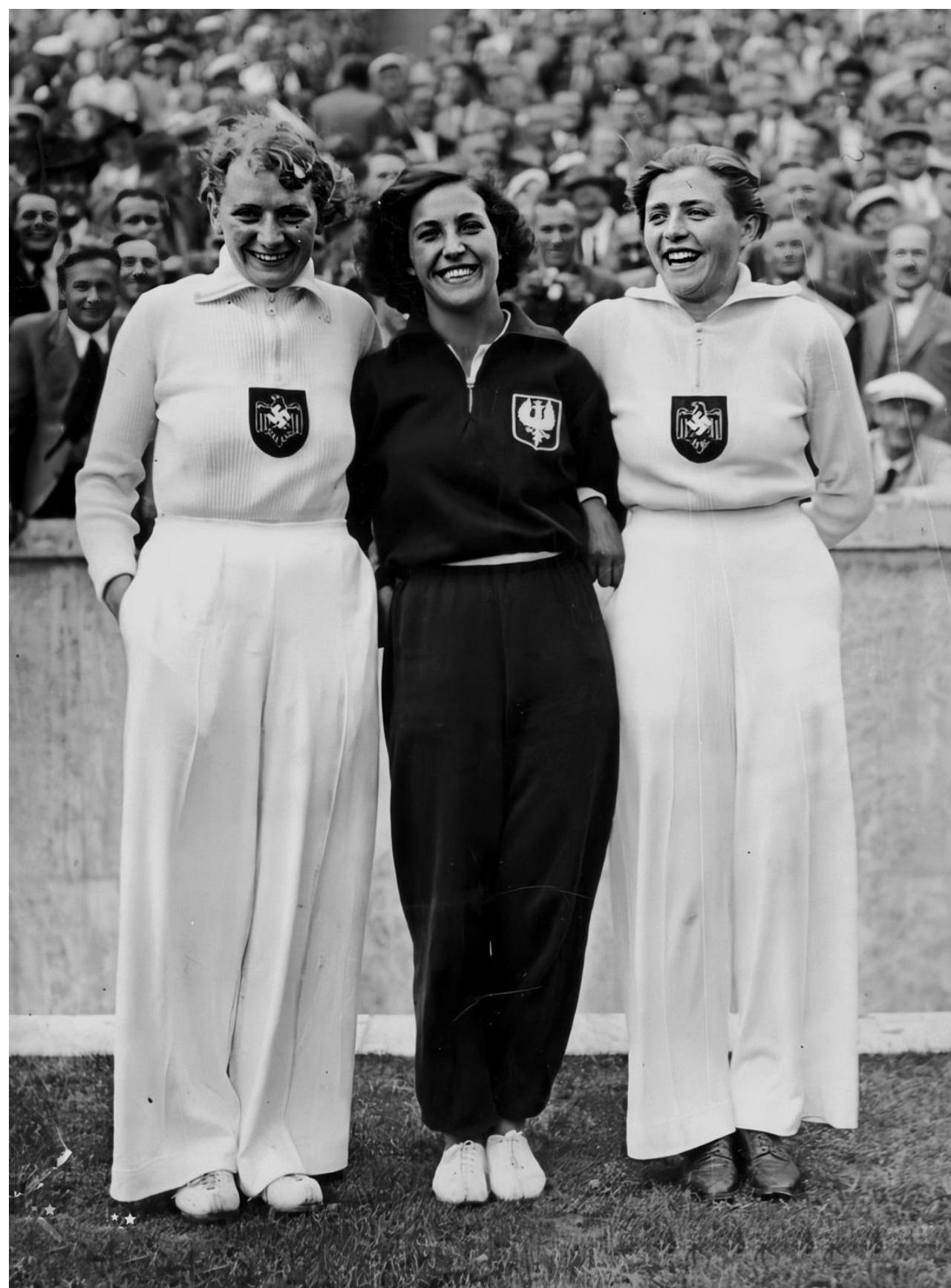
Maria Kwaśniewska na Letnich Igrzyskach Olimpijskich w Berlinie, sierpień 1936 r.

Miała 166 cm wzrostu. Ważyła 65 kg. Oszczep poleciał na 41 m 80 cm. Krążą opowieści o jej rozmowie z Hitlerem: – Taka mała Polka, a tak daleko rzuca – miał powiedzieć w loży honorowej, do której została zaproszona.