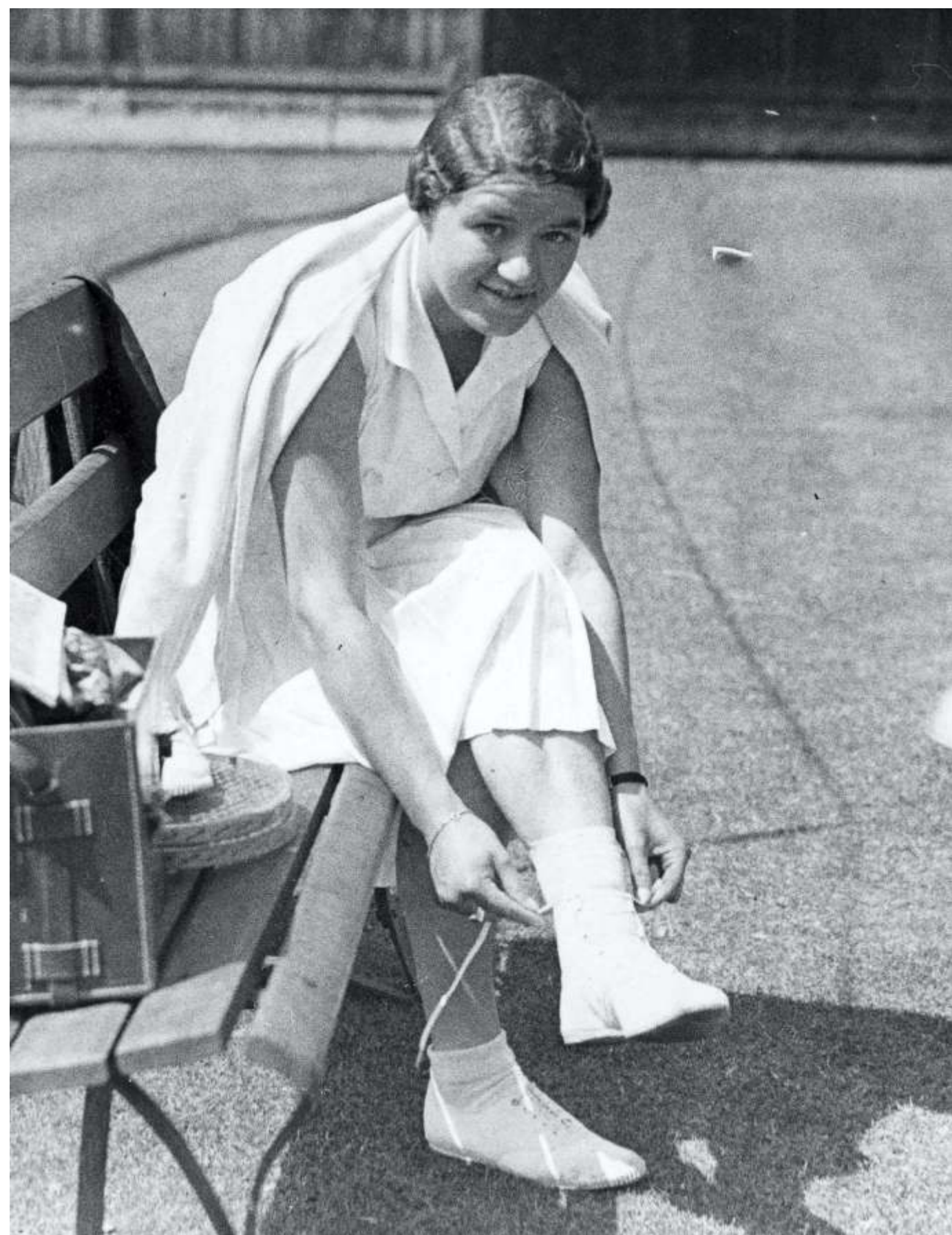
Międzynarodowy Turniej Tenisa Ziemnego w Queen`s Club w Londynie, 1932 r.

Była tak popularna, że powstał nawet film „Jadzia” z Jadwigą Smosarską, inspirowany jej karierą.