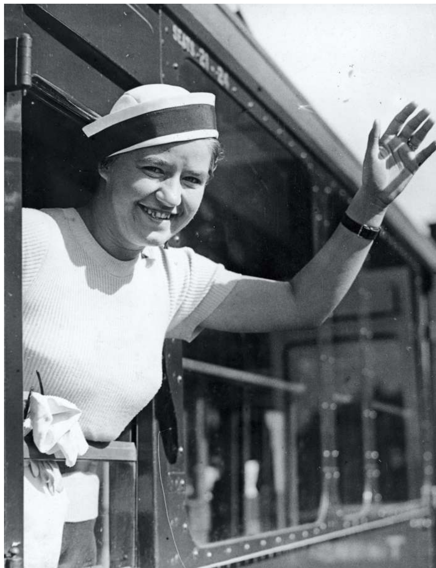
W drodze do USA na Międzynarodowy Turniej Tenisa Ziemnego na stacji Waterloo, lipiec 1937 r.