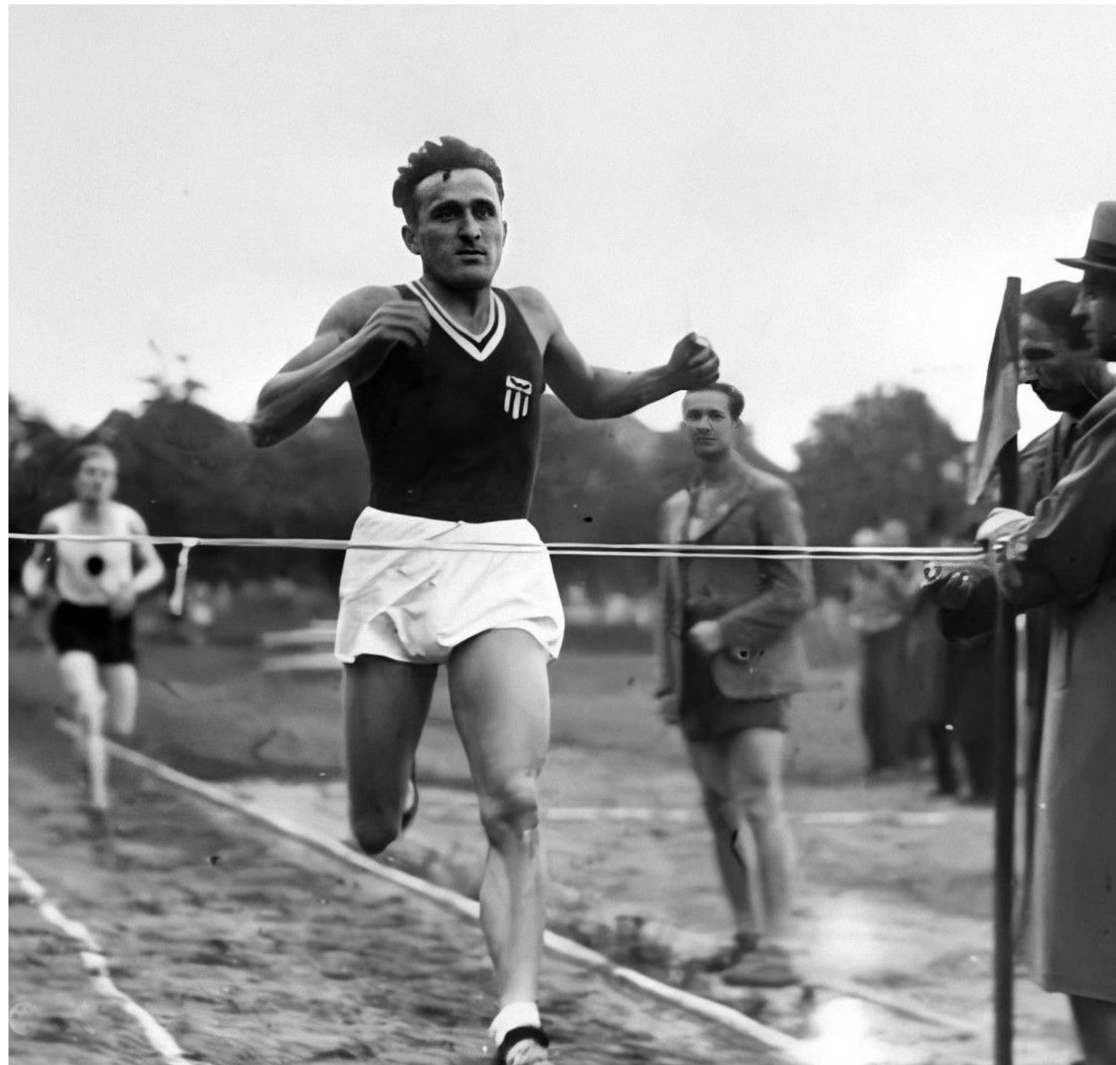
Janusz Kusociński przekraczający metę jako zwycięzca biegu.