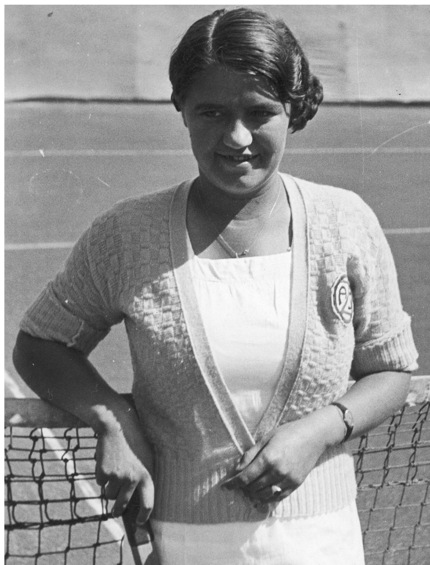
Tenisowe mistrzostwa Polski w Katowicach, sierpień 1933 r.